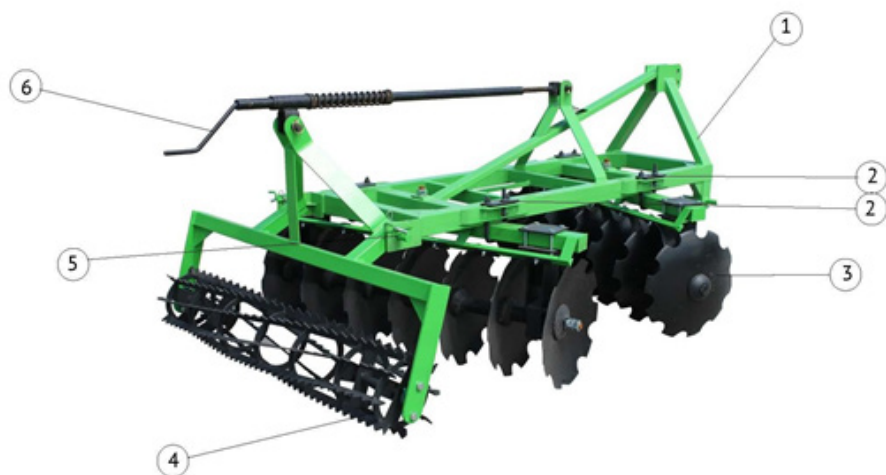
Рис. 1 Конструкция бороны Флагман

ВНИМАНИЕ! В зависимости от исполнения агрегата и национальных требований комплектация агрегата может отличаться.