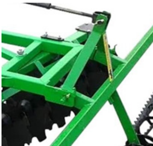
Рис. 4 Механизм соединения шлейф-катка