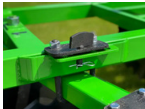
Рис. 2. Фиксирующий стопор