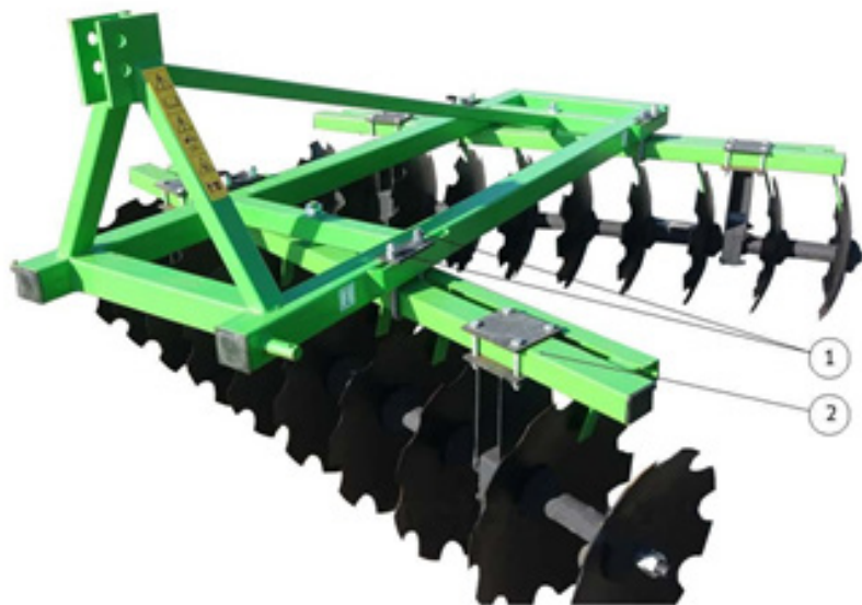
Рис. 3 Регулирование угла атаки бороны Флагман